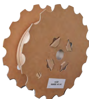
Rouleau de 100 ml